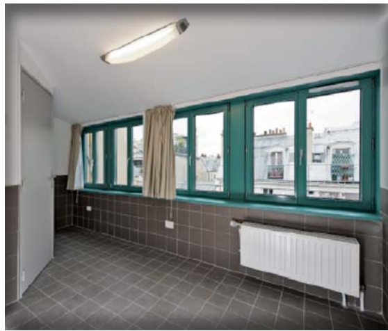
Chambre carrelée permettant l'accueil de personnes et de leurs animaux domestiques.

Travaux : Janvier 2010-juillet 2011. Réouverture : 2 août 2011 Maître d'ouvrage : RIVP (propriétaire du bâtiment) Architecte : Dominique Tessier Financeurs travaux : Etat – Ville de Paris – Ré- gion Ile-de-France – Dépar- tement de Paris