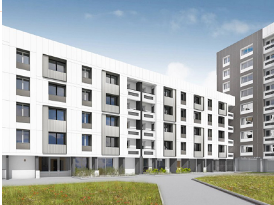
Visuel provisoire du projet © Groupe Arcane Architectes